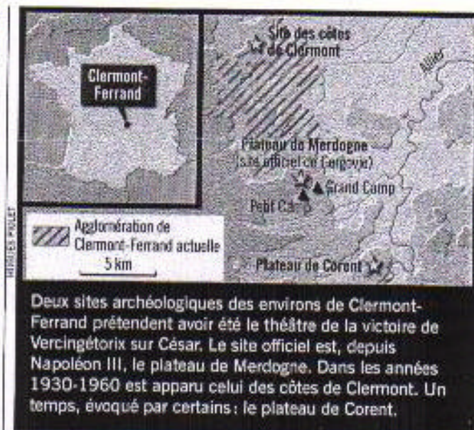
Deux sites archéologiques des environs de Clermont-Ferrand prétendent avoir été le théâtre de la victoire de Vercingétorix sur César. Le site officiel est, depuis Napoléon III, le plateau de Merdogne. Dans les années 1930-1960 est apparu celui des côtes de Clermont. Un temps, évoqué par certains : le plateau de Corent.