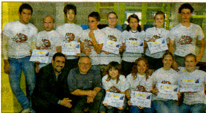
DIPLOMES. Les jeunes à l'occasion de la cérémonie de clôture.