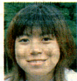
Wakako 20 ans, Japonaise

Je voulais partir à l'étranger pour les vacances... Le chantier, c'est la combinaison parfaite : on fait un travail sympa seulement quatre heures par jour et on rencontre des jeunes de cultures différentes. En plus, on a nos après-midi de libre, ce qui permet d'aller se balader et de découvrir la ville. On a participé à un tournoi de volley à Sable Show, j'ai adoré... Les Français sont accueillants, je ne suis pas déçue et je pense refaire un chantier l'an prochain.